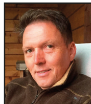
Per Ivar Solheim